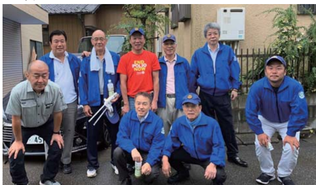
(10月8日 ロードサポート活動) ゴミを収集できました。