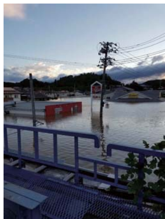
スーパーや飲食店が完全に水没(本宮市)