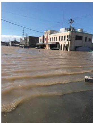
富久山自動車学校前(郡山市)