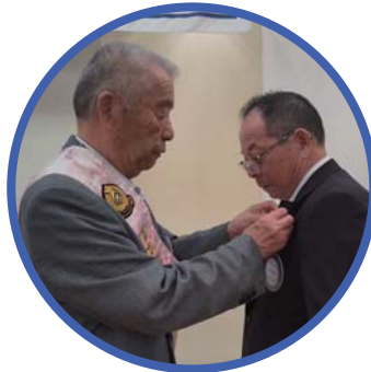
山口進会長エレクトより大内会長へ