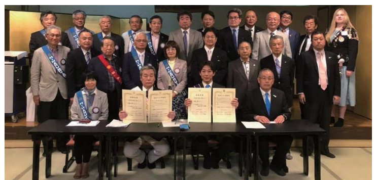
春日部西ロータリークラブ