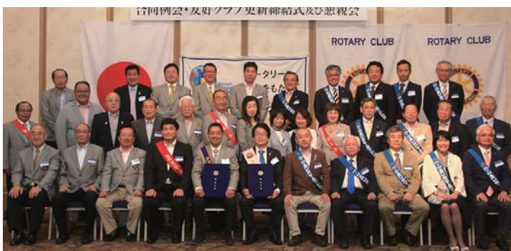
八潮ロータリークラブ

そういえば・・・友好クラブ再締結も本来なら昨年度・・・でしたがしておりません。。オンラインZoomでもかまいませんので、友好クラブ再締結(^)をしたいです。さらに、、通常の例会もオンラインしていますので、いつでも例会を覗きにきていただけるよう連絡を取り合ってみたいと思います。ご清聴ありがとうございました。