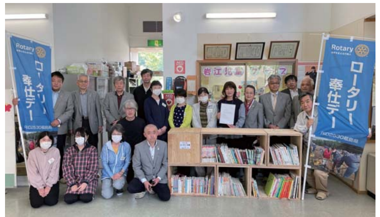
●岩江地区児童施設