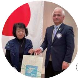
(2位) 三條会員 奥様