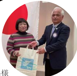
(4位) 川又会員 奥様